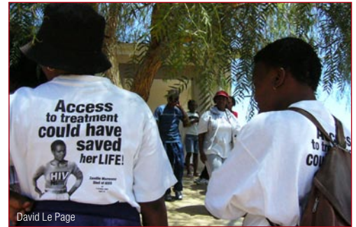
Initiation au traitement : des animateurs de la Campagne d'accès au traitement (TAC) mobilisent les communautés à Grahamstown, dans la province orientale du Cap (Afrique du Sud).

L'OMS espère que ce contrat sera le premier d'un processus continu au sein du Programme de préparation au traitement, afin de soutenir les nouvelles activités de préparation communautaire au traitement et d'encourager la diffusion des meilleures pratiques.