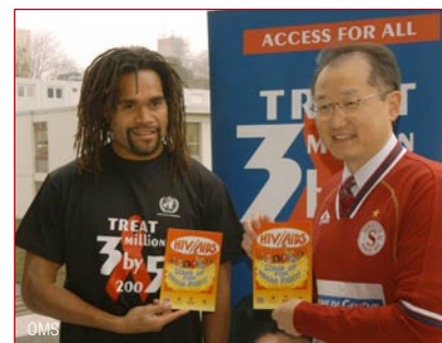
Le footballeur Christian Karembu et le Dr Jim Yong Kim, directeur du VIH/SIDA à l'OMS, lors de la présentation de la bande dessinée.

pour diffuser des messages importants pour les droits de l'homme et la santé publique», a déclaré M. Sepp Blatter, Président de la FIFA.