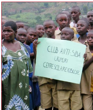
Le projet mixte 'Santé scolaire/prévention du VIH' consiste à former autant d'enseignants que possible, dans autant d'écoles que possible, pour contribuer à prévenir l'infection.

Le VIH/SIDA est littéralement en train de vider les écoles de leur vie. En Afrique subsaharienne, des classes sont vidées par le décès de nombreux enseignants en raison de maladies liées au SIDA. Les enfants disparaissent également, certains emportés eux-mêmes par le VIH/SIDA, et bien d'autres obligés d'interrompre leurs études pour s'occuper de leurs frères et sœurs après la mort des parents.