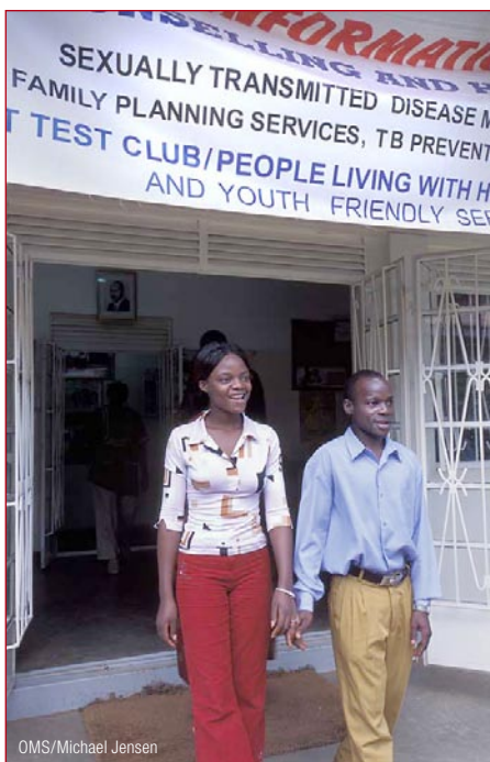
En Ouganda, les services de dépistage et de conseil ont été étendus.