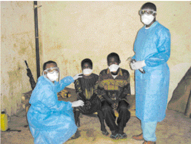
Figure 4 - Prise en charge des patients.

de détecter par immunochromatographie un antigène spécifique de Y. pestis (3) (Fig. 3). Bien qu'extrêmement prometteur, ce test est encore en cours d'évaluation sur le terrain dans plusieurs pays africains et ne pouvait pas permettre de lever totalement l'incertitude. En tout état de cause, le protocole thérapeutique et les mesures de contrôle mis en place, basés sur l'hypothèse d'une épidémie de peste pulmonaire, ont montré qu'ils étaient de nature à réduire la létalité ainsi qu'à limiter l'apparition et la dissémination de nouveaux cas. Cent soixante treize échantillons ont été collectés lors de la mission et sont encore en cours d'analyse dans plusieurs laboratoires internationaux. Si la souche bactérienne ne sera sans doute jamais isolée, la nature de l'épidémie ne fait cependant plus aucun doute grâce en particulier à la mise en évidence d'une séroconversion chez plusieurs patients et la révélation de l'antigène spécifique F1 par plusieurs méthodes différentes et indépendantes.