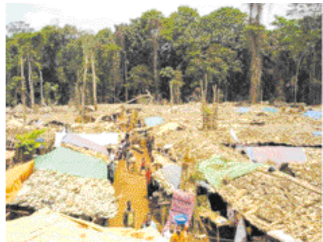
Figure 1 - Le camp minier de Damaseke

Lorsque les conditions d'hygiène sont précaires, l'homme peut se trouver au contact de rongeurs et être à son tour victime de piqûres de puces infectées. Il développe alors un syndrome infectieux sévère, c'est la forme bubonique de