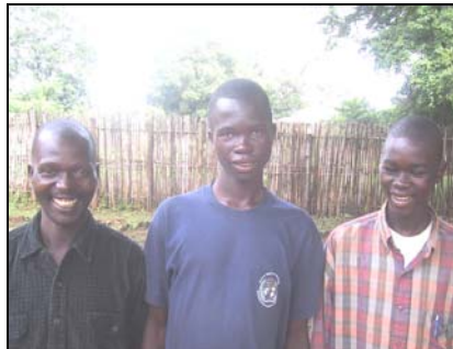
Dominic, Gibson na Emmanuel ngagu bambata aboro ia wisigiyo na makana bi kaza nangbongi kibi kaza tiyo –EBOLA Ifu dawa fuyo kina bakere bambu ngua Yambio yo, iki hu be kaza nangbongi ngaga ebola.