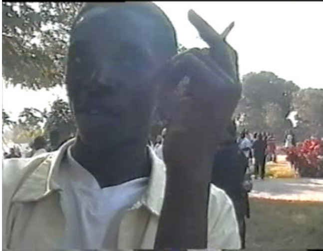
Les enfants fumeurs de la ville de Lubumbashi