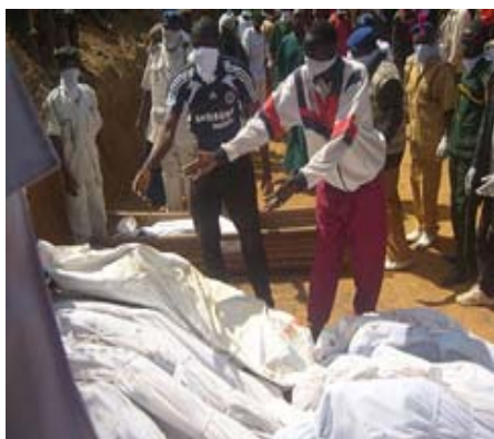
Des volontaires disposent des corps dans une fosse commune suite à la violence ethnoreligieuse de Jos/ Nigeria