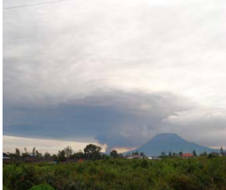
Cendres volcaniques du volcan Nyamulagira, Goma/RDC