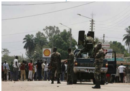
Côte d'Ivoire, manifestants retenus par les Forces de sécurité à Toumodi

Zimbabwe: Epidémie de choléra, 77 cas au total et 1 décès (létalité: 1,3%) ont été notifiés au 24 février 2010; 7 districts sur 62 dans le pays sont touchés comparé à 54 districts l'année passée à la même période avec une létalité qui était à 4,8%*.