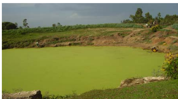
Marre d'eau de boisson à Bolo Gebriel/Ethiopie