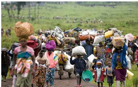
Déplacements continus des populations, Nord Kivu/RDC