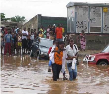
Inondations en Angola, retrospective