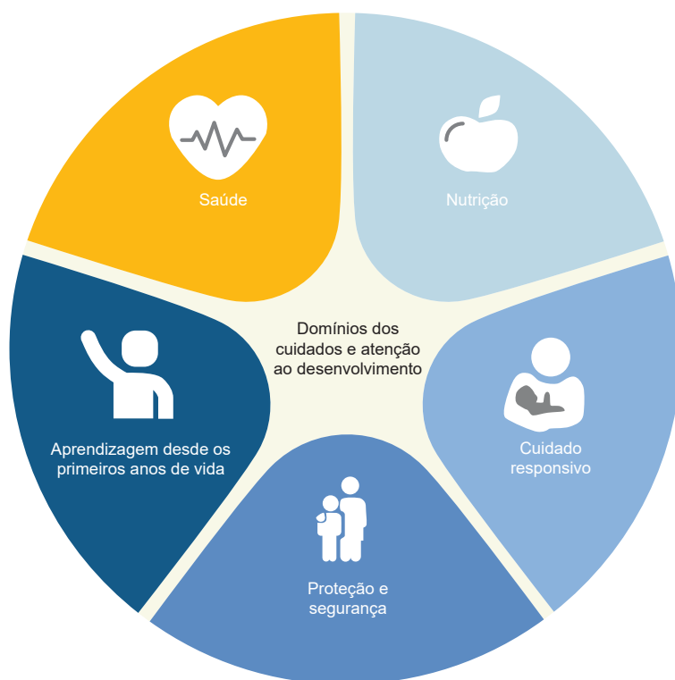
Figura 1. Domínios dos cuidados e atenção ao desenvolvimento necessários para que as crianças desenvolvam todo o seu potencial

Vários fatores influenciam a aquisição de competências e habilidades, incluindo saúde, nutrição, segurança e proteção, cuidadores responsivos e aprendizagem precoce (Figura 1). Cada um deles é necessário para promover os cuidados com o desenvolvimento. Esses cuidados reduzem os efeitos nocivos das desvantagens na estrutura e função cerebral e, por sua vez, melhoram a saúde, o crescimento e o desenvolvimento das crianças 7 .