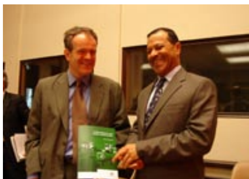
Presentación del manual por Su Excelencia Fuad Mubarak Al-Hinai, representante permanente de la Sultanía de Omán ante las Naciones Unidas.

Por caminos seguros está disponible en nuestro sitio web: www.who.int/violence_injury_prevention/en/ , donde se publicará en seis idiomas. La dirección para solicitar ejemplares impresos es traffic@who.int .