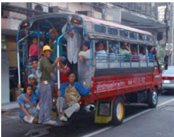
Minibús en Bangkok (Tailandia).

2. Para esta estimación se han empleado la misma metodología y los mismos supuestos principales (como las proyecciones del PIB) que en Traffic fatalities and economic growth , de Kopits y Cropper, World Bank Policy Research Working Paper 3035, abril de 2003.